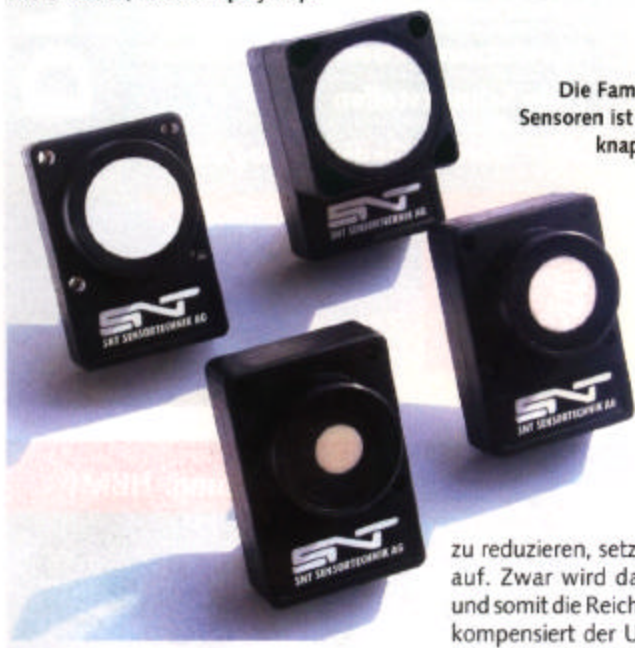
Die Familie der UPK-Ultraschall-Sensoren ist zu ihren Vorgängern um knapp 50 Prozent kompakter